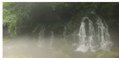
鳥海山の湧水 元滝伏流水 (秋田県にかほ市)