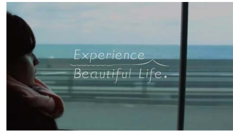
「Experience Beautiful Life.」タイトルロゴ