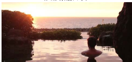
夕陽が美しい露天風呂がある 「大観荘 せなみの湯」(新潟県村上市)