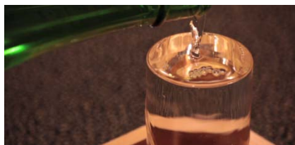
大山新酒・酒蔵まつり (山形県鶴岡市)