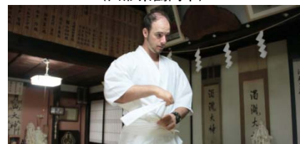
山伏修行ができる「大聖坊」 (山形県鶴岡市)