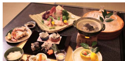
羽越観光圏の冬の食