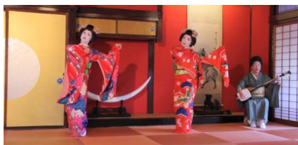
舞娘茶屋の「相馬樓」 (山形県酒田市)

「日本海きらきら羽越観光圏」では、近隣の観光地同士が連携し、互いの観光資源の魅力を引き立てながら、エリアの魅力向上を図る取り組みを行っています。国際競争にも対応できる観光地づくりを目指し、今後も活動していきます。