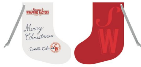
<メッセージカードイメージ>