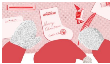
<ムービーイメージ>