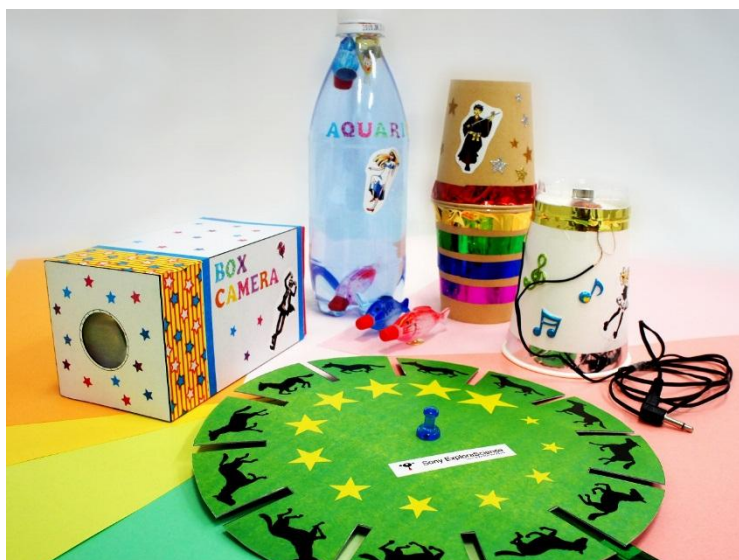
<わくわく科学工作教室 実施概要>