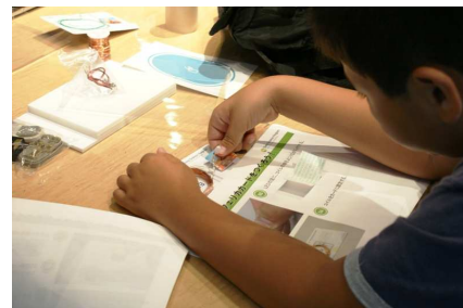
写真(3点)は『ソニー・サイエンスプログラム』(09年8月開催)開催時の様子