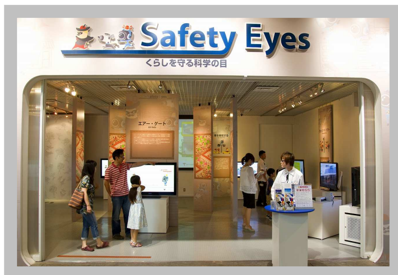
企画展『Safety Eyes -くらしを守る科学の目-』外観