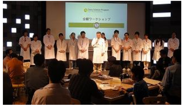
※過去開催の「分解ワークショップ」の様子