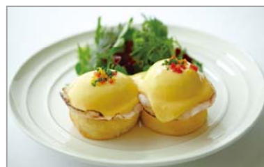
代表メニュー クラシックエッグベネディクト