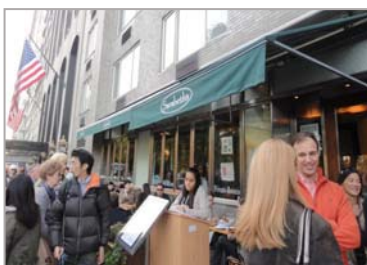
NY アップーウエスト店