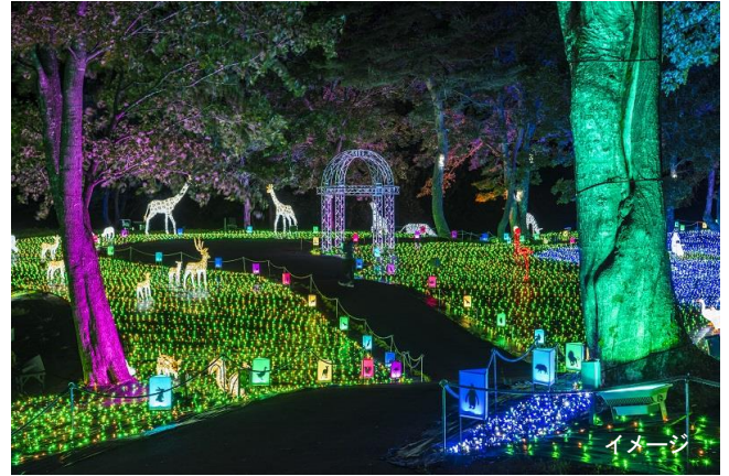
【演出②】 花と光のコラボレーション ロマンチックな薔薇世界「絶景フラワーロード」