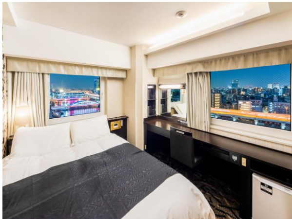
■コーナービュールーム