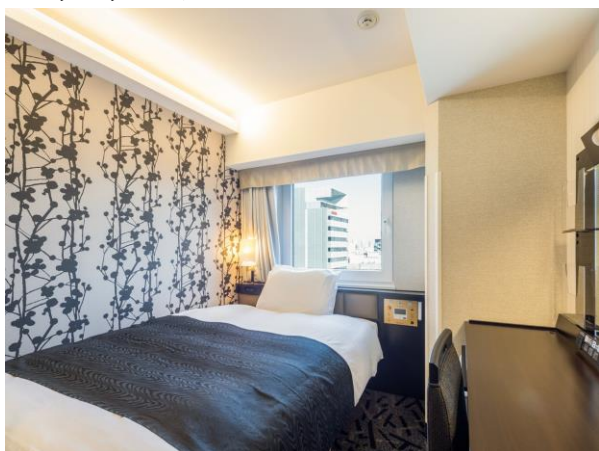
■スタンダードルーム