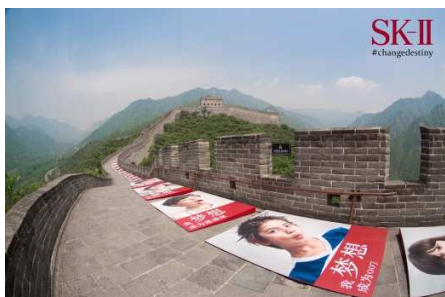
【中国】世界遺産・万里の長城でアートインスタレーションを展開。北京市内でイベントも実施

2016年6月21日「もう一度夢を見よう。」をテーマに、世界10都市のランドマークや繁華街にて著名人や子ども達と共に一般消費者向けイベントや屋外広告を同時に展開しました。