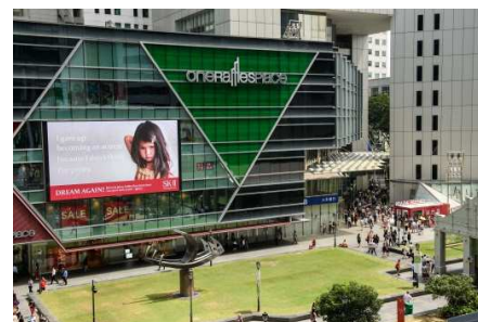
【シンガポール】金融街の中心でもあるラッフルズプレースで、メッセージを発信