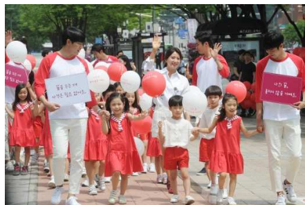
【韓国】赤と白の風船を持った子ども達がソウル市内の繁華街江南を行進