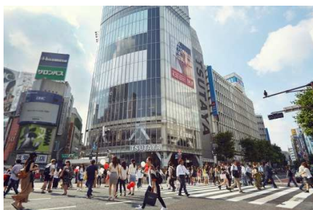
【東京】渋谷の街でイベントを執行。日本最大規模の渋谷スクランブル交差点での広告掲示も