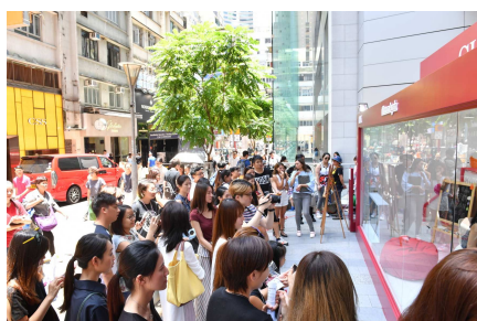
【香港】コースウェイベイのランドマーク「ハイサンプレス」にてイベントを実施