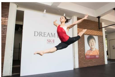
【マレーシア】クアラルンプールにて金メダリストなどを招いたイベントを展開