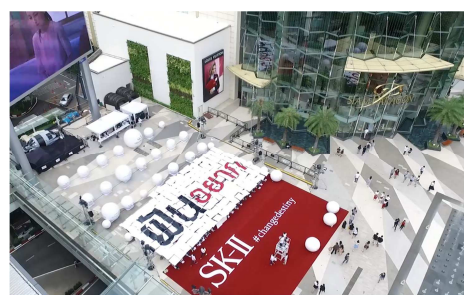
【タイ】バンコクの大規模商業施設「サイアム・パラゴン」で巨大な屋外広告とイベントを実施