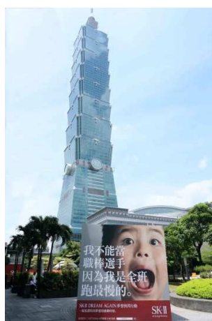
【台湾】台北のシンボルタワー「台北101」前などで屋外広告を展開