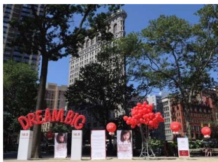
【ニューヨーク】マンハッタンのマディソン・スクエア・ガーデンでSK-IIがアートインスタレーションを実施