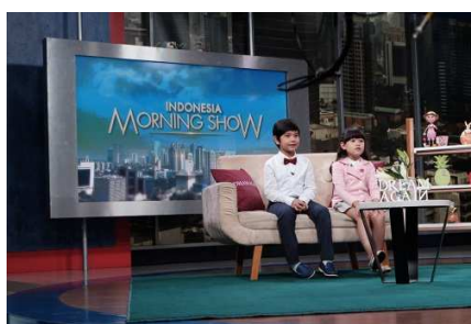
【インドネシア】人気番組「MORNING SHOW」で紹介