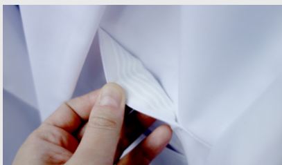
落ちない特殊生地テープ