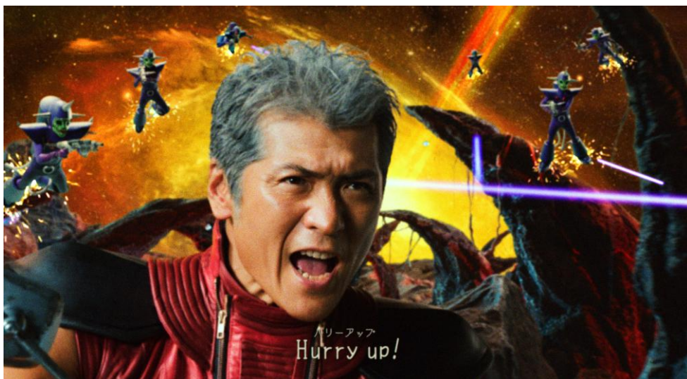
「エクストリーム！篇」より

40周年というメモリアルイヤーに出演できて嬉しいです。U.F.O.を食べたくなるCMになったかと思えます。