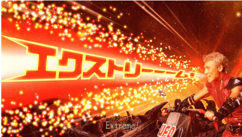
「エクストリーム！篇」より