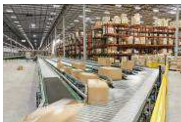
PFSweb フルフィルメントセンター