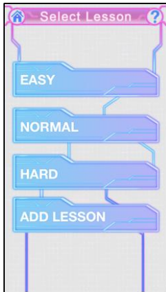
レッスン選択画面