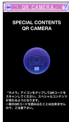
SPECIAL コードキャプチャ画面