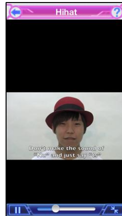
レッスン画面(フル)