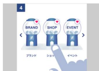
「ANA スカイ ガッチャ!モール」内の気になるお店を選んでガッチャを回す