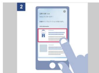
インフォメーション画面内の「ANA スカイ ガッチャ!モール」の記事をタップ