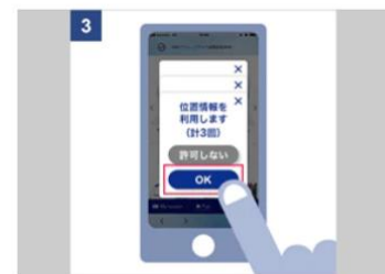
端末の位置情報をON（端末およびアプリ）にし、位置情報を許可する