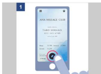
ANAマイレージクラブ アプリのメニューボタンをタップし「インフォメーション」画面を開く