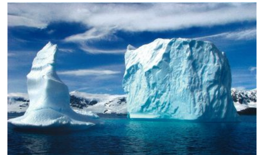
幻想的な氷の世界「ウェッデル海」