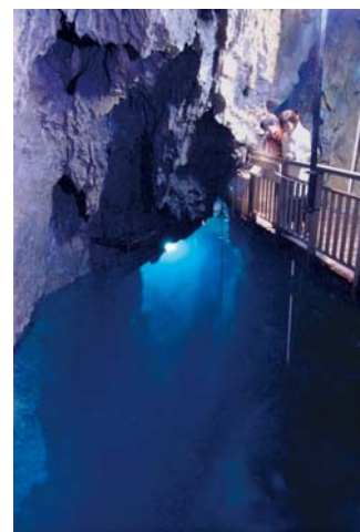
龍泉洞(イメージ)