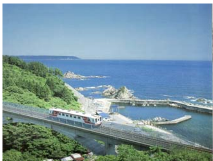
三陸鉄道北リアス線(イメージ)