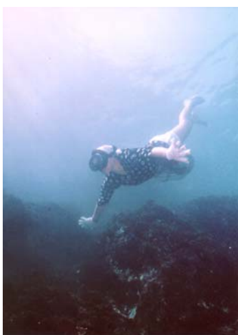
北限の海女(イメージ)※