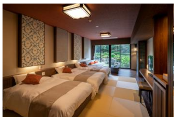
『リニューアル客室』