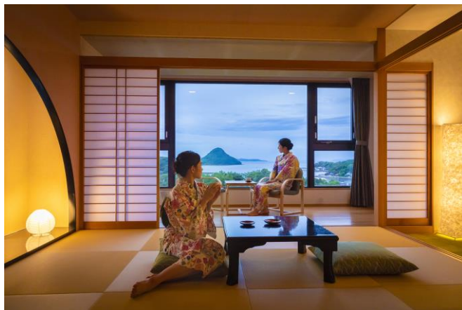
『天草の海を臨む客室』