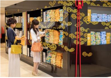
選べる色浴衣コーナー