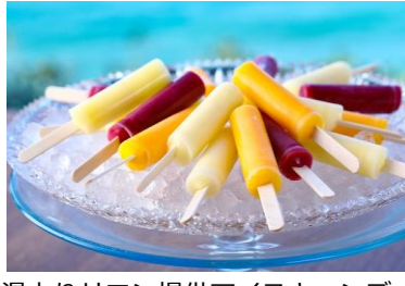
湯上りサロン提供アイスクャンディ