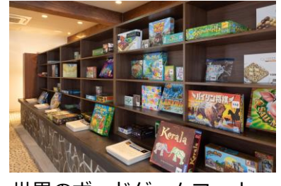
世界のボードゲームコーナー