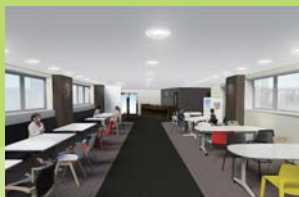
コワーキングスペース