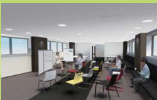
セミナーイメージ