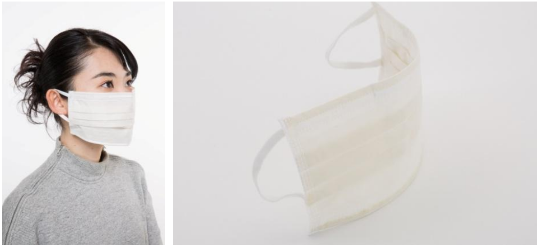
『kokua UV CUT MASK』 http://kokua.jp

株式会社 kokua（本社：東京都千代田区、代表取締役：坂巻玲衣）は、紫外線カット専用マスク『kokua UV CUT MASK』をリニューアル、2016年4月19日（月）より販売を開始しました。