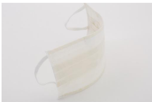
kokua UV CUT MASK