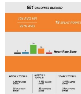
↑ メールで送付されるワークアウト結果