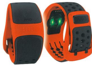
↑ ハートレート・センサー