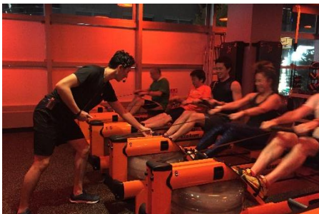
↑ エネルギー溢るようなコーチのリードでモチベーションアップ

全世界のスタジオ共通で本部より配信されるプログラムは毎日変わるので、飽きることがありません。アップビートな音楽、オレンジを基調とした洗練されたデザインのスタジオも気分を盛り上げます。