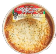
※パッケージ(イメージ)