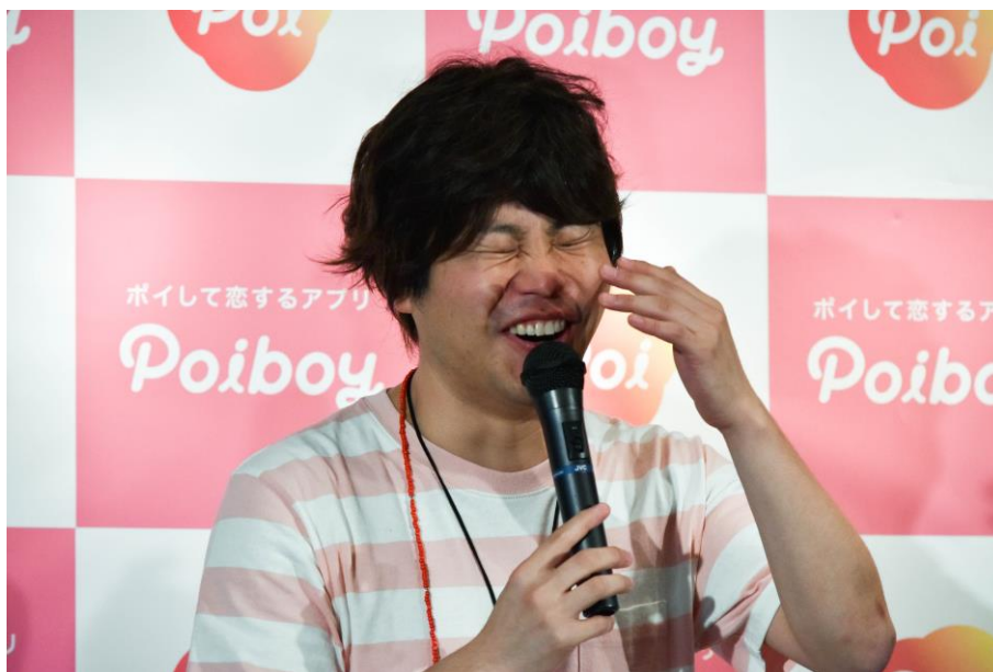
失敗に悲しむ NON STYLE 井上さん