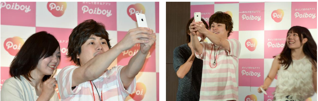
ギネス世界記録へのチャレンジ中

第2回目の挑戦では、横にどんどん人が流れていきます。作戦は成功したと思われました。しかし、審査の結果、移動が高速過ぎたのかピントの合わない写真が多く121枚中、84枚が有効写真となり、記録の118枚には届かず、残念なことにギネス世界記録への挑戦は失敗に終わりました。