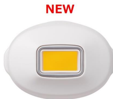
フェイシャルアタッチメント