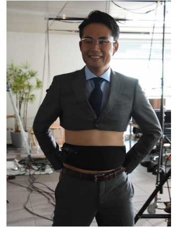
胸下でざっくりと切られた、斬新な衣装。