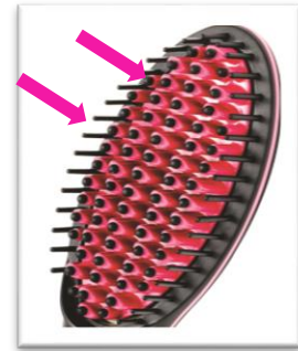
耐高温プラスチックを採用