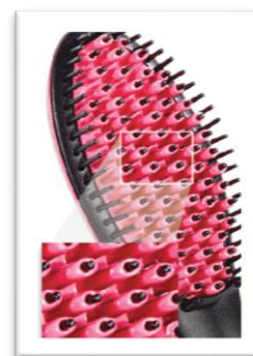
3Dセラミックコーティング

「シンプリーストレート」は、ヘアブラシとヘアアイロンを1本に融合した2 in 1 構造。ブラシの1本1本に熱が通るので、ブラッシングと同時に髪の毛に熱を伝えてストレートヘアに整えていきます。また、ブラシ1本1本を立体的にセラミックでコーティングした3Dセラミックコーティングにより、ブラッシング時の髪の毛のすべりを良くし、摩擦による痛みを少なくしてくれます。ブラシタイプなので、プレートで挟み込むストレートアイロンとは違い、髪を押しつぶすこともなく安心です。