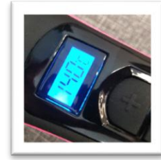
デジタル温度ディスプレイ