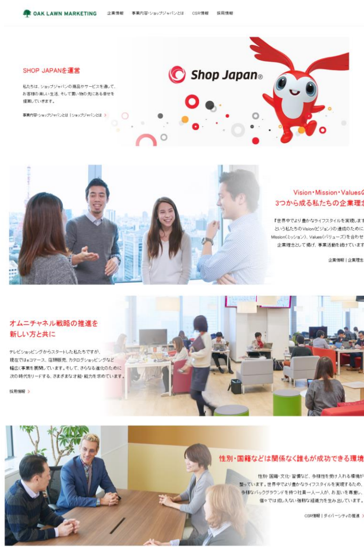
コーポレートサイト TOP ページ (バナー)

また、当社に入社を希望される皆様に対し、企業風土も理解していただけるよう、当社にまつわる様々な数字に着目し、ご紹介するコンテンツを新たにご用意しました。