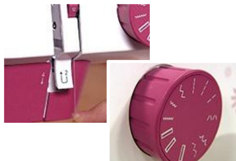
シンプル設計で操作が簡単