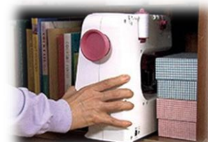
※イメージ写真は、ホワイトを使用

重量は約 2.3 kgと軽量で持ち運びが便利なおうえに、省スペースで収納場所にも困りません。