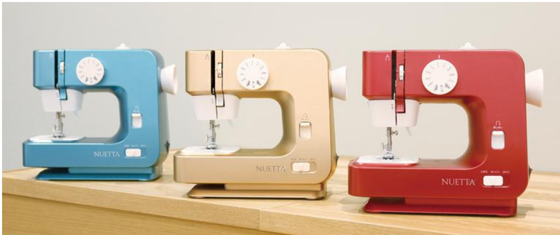
（左から：ターコイズブルー、 シャンパンゴールド、 パールレッド）