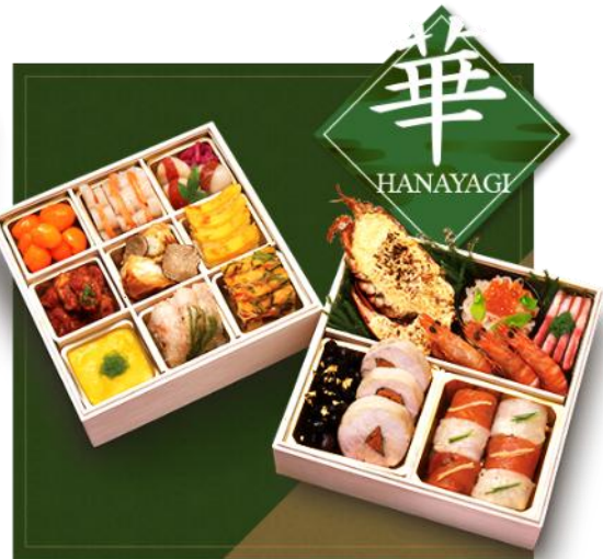
「プレミアムおせち華（はなやぎ）」イメージ