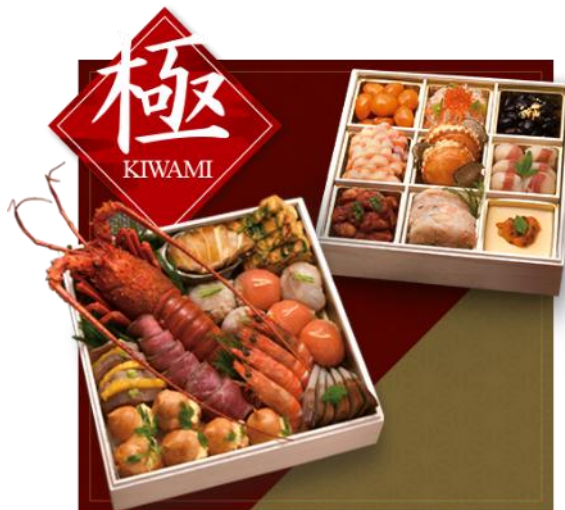
「プレミアムおせち極（きわみ）」イメージ