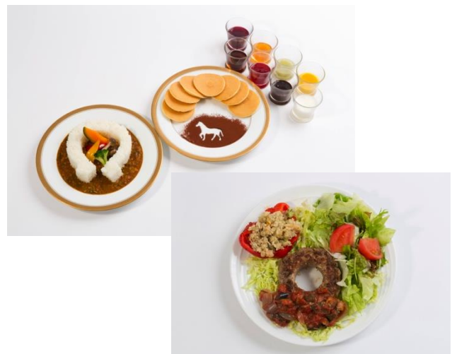
『18食材の馬蹄型ライスカレー』、『ミニホットケーキの8種ソースダービー』(上)と、『大穴ハンバーグと18種類ダービープレート』(下)