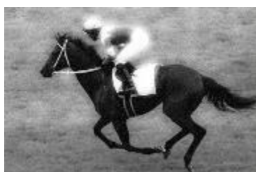
伝説のダービー馬マツミドリ