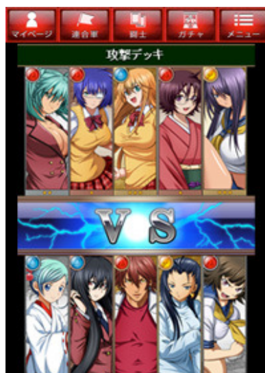
連合軍バトルに勝利し NO.1 を目指せ！

他に、連合軍メンバー同士で親交を深め、シナリオモードでは 9 種類の秘宝*をメンバーが協力して集めたり、バトルモードではメンバーで一致団結して他の連合軍と闘い、連合軍ポイントを相手よりも多く獲得して勝利していくというソーシャル要素もふんだんに盛り込まれたカードゲームとなっております。