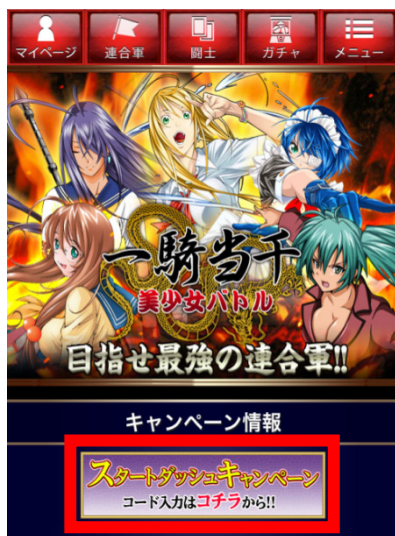
キャンペーンバナーをクリック

入手したシリアルコードは、ゲーム TOP 画面のキャンペーンバナーの先にあります、コード入力ページにてご入力ください。