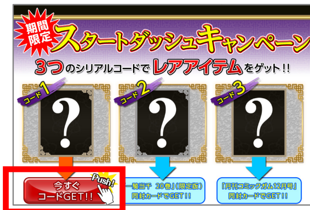
「今すぐコード GET!!」をクリック