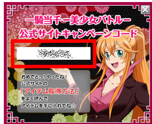
キャンペーンコードが表示