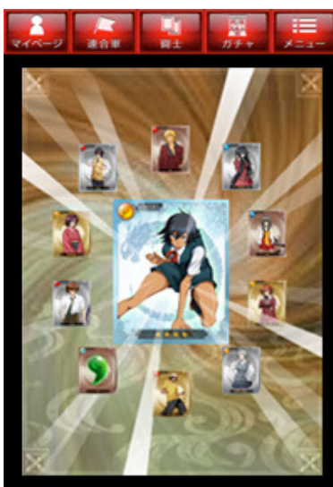
集めた闘士を合成して強化