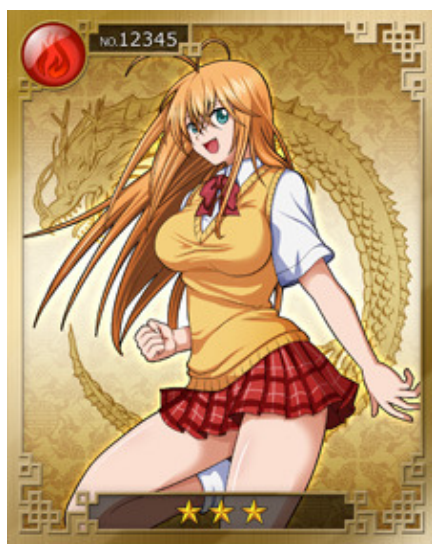
シナリオを進めて闘士を GET

また、気の合う仲間同士で『連合軍』と呼ばれるチームを結成し、強化した闘士を使ってバトルモードで他の連合軍とバトルを行い、勝利すると獲得できる連合軍ポイントで連合軍の頂点を目指します。