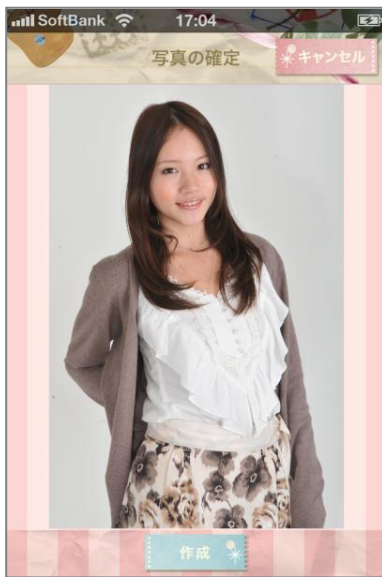
<写メ字にしたい写真を選択>

このメール機能は、「i.spftbank.jp」または「Gmail™」のメールアドレスの設定でご利用いただけます。