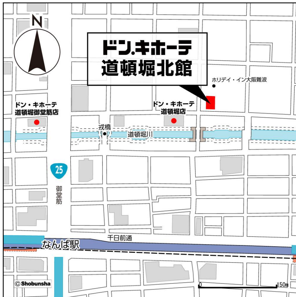
ドン・キホーテ道頓堀北館周辺地図