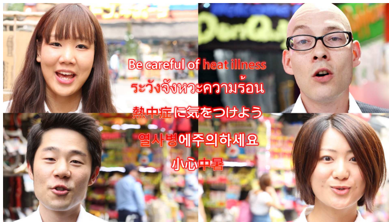
啓発動画（イメージ）