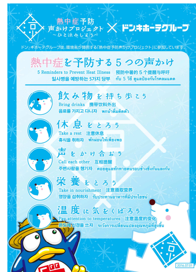
啓発ポスター（イメージ）

■「熱中症予防声かけプロジェクト」について 熱中症についての正しい知識の普及啓発とその予防を目的に、環境省をはじめ、行政・企業・団体が官民一体で取り組むプロジェクトです。参加自治体や企業が共通ロゴマーク等を用い、各々の活動を通じて国民や訪日客に啓発活動を実施します。