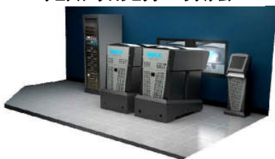
デュアル・プロジェクター・システム