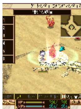
街の周囲には砂漠の フィールド「迷いの砂漠」