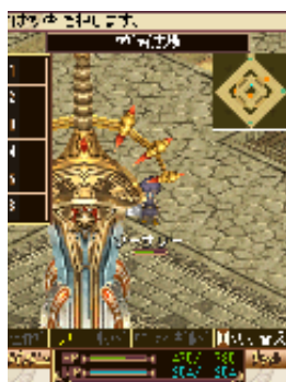
「ツヴァイ」の街の中央には 象徴たる巨大な剣。