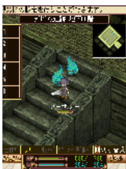
新規追加された 「デビース遺跡」。