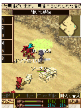
「ゴブリン」の新たな 属性種も登場。