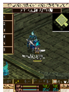
遺跡には強力な モンスターが目白押し。