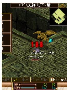
「デビース遺跡」には ボスも登場。