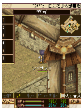
砂漠の民が住まう 「ツヴァイ」には風車がある。