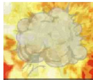
【ボス戦】 爆弾での攻撃