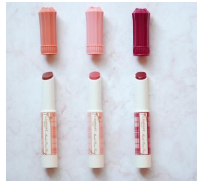
左から 01 バタースコッチ 02 モモ 03 ワインベリー