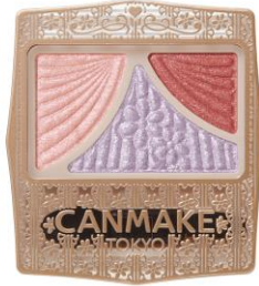
16 シルエットサンライズ

ベースにフレッシュなオレンジラメをのせて調整した後、ラインカラーとしてパープルをオン。 青すぎないパープルがポイントです。