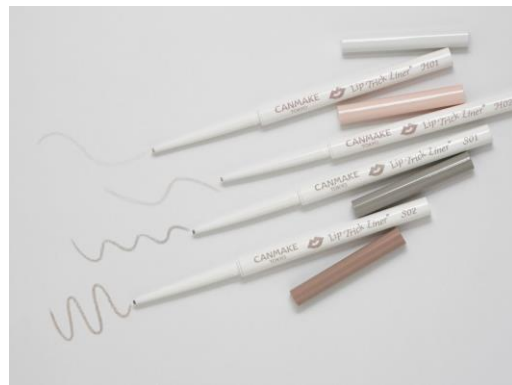
上から： ハイライトカラー／H01、H02、 シェーディングカラー／S01、S02