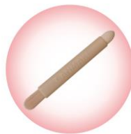
肌当たりの良いブラシと ピンポイントに使えるチップのダブルエンド