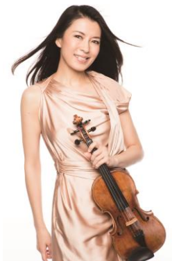
川井 郁子 ヴァイオリン