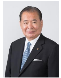
立石 義雄 京都商工会議所会頭 オムロン株式会社 名誉会長