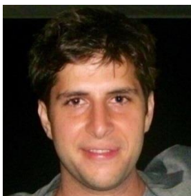
エリック・ニアリ CINERIC INC.『雨月物語』 復元担当