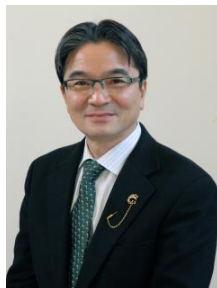
宮田 亮平 文化庁長官