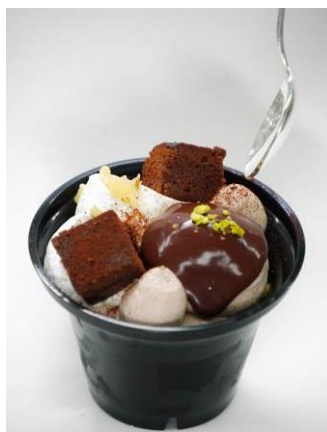
コミットチョコパフェ