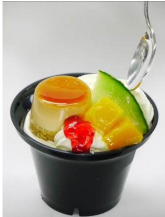
コミットプリンパフェ