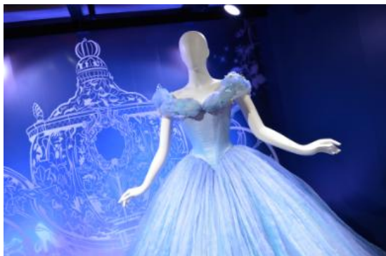
映画「シンデレラ(2015年)」 舞踏会コスチューム