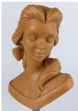
「美女と野獣」ベルの胸像 (1991年)