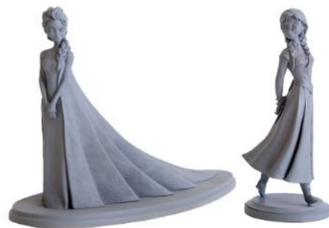
「アナと雪の女王」アナ&エルサ アニメーション・マケット(2013年)