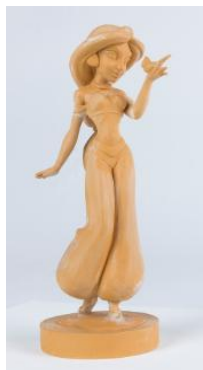
「アラジン」ジャスミン アニメーション・マケット (1992年)