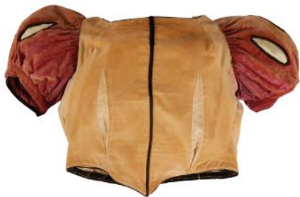
「白雪姫」 白雪姫のアニメーション参考衣装(1936年頃) アニメーターがキャラクターを描くときの参考のため、 演技をした女優が着用した衣装。 ウォルト・ディズニー・アーカイブス衣装コレクションの なかで最も古いもの。