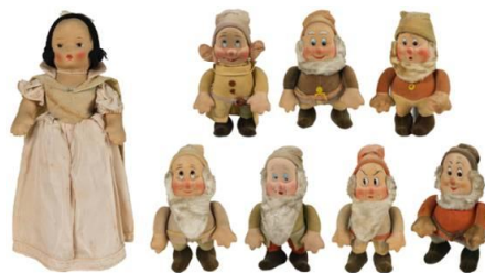
「白雪姫」 R.G.クルーガー社アンティーク人形(1938年頃)