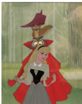
「眠れる森の美女」 オリジナルセル画(1959年)