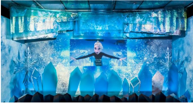
「アナと雪の女王」特別映像シアター

また、臨場感あふれる“光と氷のプロジェクション演出”とともに、世界25カ国の言語で歌いつながれた「Let It Go」を鑑賞できる「アナと雪の女王」特別映像シアターは、本展覧会でしか体験できない特別な空間となっています。