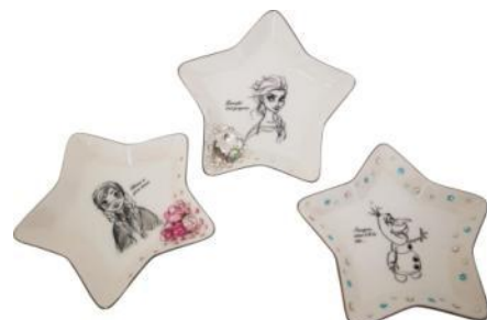
アナ/エルサ/オラフ インテリアトレイ (スワロフスキー®・クリスタル使用)