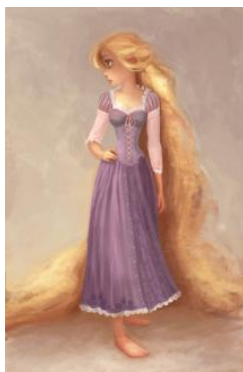
「塔の上のラプンツェル」ラプンツェル ビジュアル開発アート(2010年)