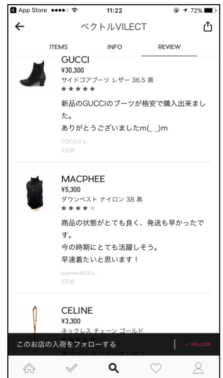
取引レビューページ