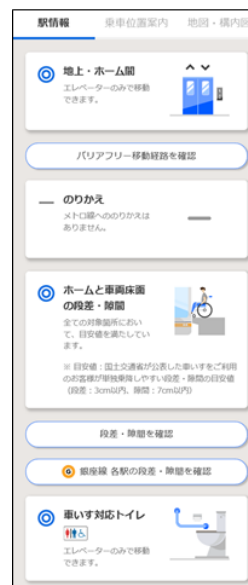
駅情報画面イメージ