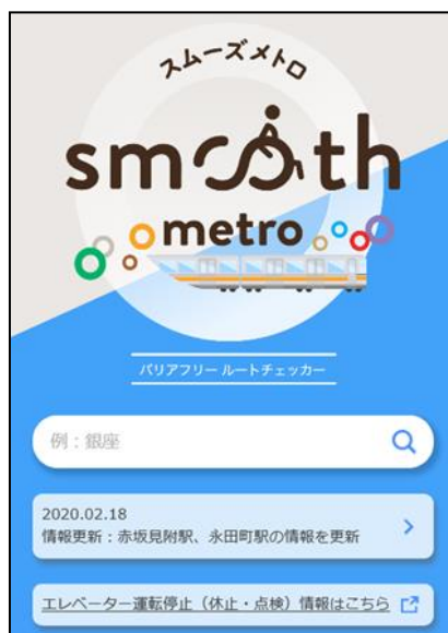
トップ画面イメージ