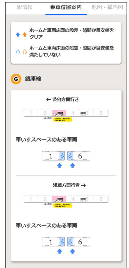
乗換位置案内 画面イメージ

駅全体の構造が分かる構内図にバリアフリー移動経路、 駅係員の対応で移動できるルート及び車いす対応トイレ を表示します。