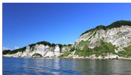
クルージングからの景観