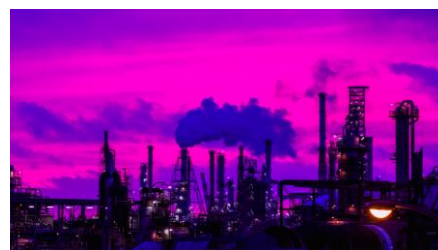
陣屋除雪ステーションからの景観