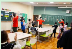
『創作ダンスで校歌を残すプロジェクト』 んまつーボス / 対馬博物館 / 宮崎大学発ベンチャー企業 一般社団法人namstrops 【宮崎県】