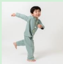
『i do button』 株式会社Discovery Kids 【東京都】