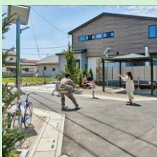
『共有地で「共助」を育み、暮らしの中で「自助」を学ぶ家』 ボラストウン開発株式会社 【埼玉県】