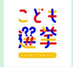
『こども選挙』 こども選挙実行委員会 【神奈川県】