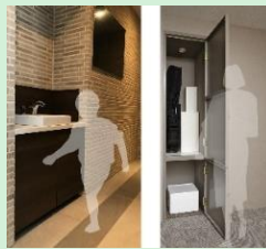
『分譲マンションにおける子育て支援サービスの提案』 積水ハウス株式会社 【大阪府】