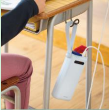
『学校向けリン酸鉄モバイルバッテリー』 エレコム株式会社 【大阪府】