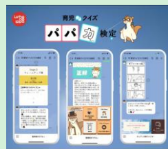
『育児クイズパパ検定』 株式会社Mama's Sachi 【東京都】