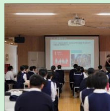
『「ALL FOR THE NEXT」次世代へ紡ぐ小国町の新しいまちづくり』 法政大学デザイン工学部川久保俊研究室 / 熊本県小国町 【東京都】