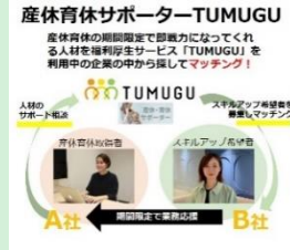
『産休育休サポーターTUMUGU』 株式会社QOOLキャリア 【東京都】