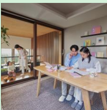
『音の自由区』 大和ハウス工業株式会社 【大阪府】