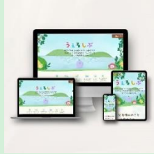
『障がいや病気の兄弟姉妹がいる子どものきょうだい向けの情報サイト「うるるしぶ」』 任意団体うるるしぶ 【東京都】