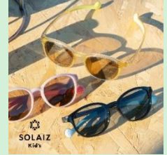
『SOLAIZ Kid's』 株式会社エリカオブチカル 【福井県】