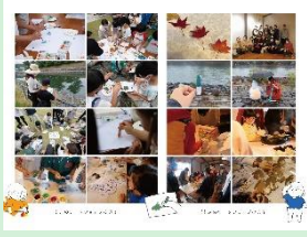
『まちいろクレヨン探検隊』 一般社団法人アーバンデザインセンター宇治 / 宇治市政策企画部政策戦略課 / 慶應義塾大学SFC石川初研究室 【京都府】