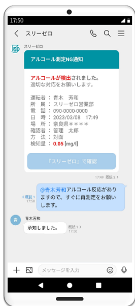
LINE WORKSへの測定NG通知 ※画面は開発中のものです。

「LINE WORKS」のチャット(トーク)で受け取ることで、安全運転管理者、副安全運転管理者、業務補助者は同時に検知内容を迅速に確認できます。その為、仮に安全運転管理者が対応できない場合も副安全運転管理者や業務補助者が対応する事が可能となります。その後の対応/やりとりも「LINE WORKS」上で可能で、管理者として誰が対応したかの対応履歴がチャット(トーク)に残ります。今後も連携強化によってさらなる効率改善につながるアップデートを検討しています。