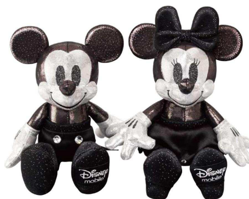
「オリジナルぬいぐるみ(ペア)」