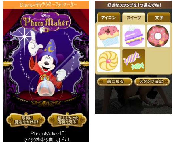
「ディズニー・キャラクターフォトメーカー」 mixi アプリ版

※3 「ディズニー・キャラクターフォトメーカー」のブログ投稿機能の対応サービスのうち、Ameba は非対応となりました。