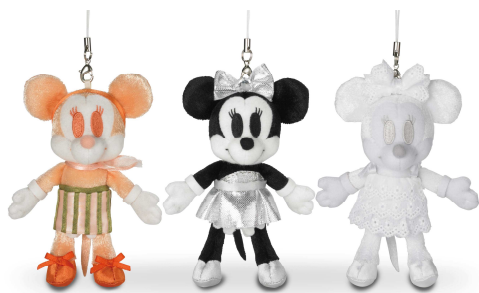
「梨花セレクト！ミニストラップセット(3個)」