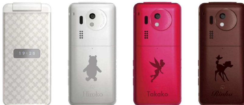
ディズニー・モバイル「DM006SH」

DM006SH および DM005SH の購入を伴う新規ご契約または機種変更で、好きなキャラクターモチーフと名前などの好きな文字をいれたオリジナルバッテリーカバーをプレゼントします ※4 。