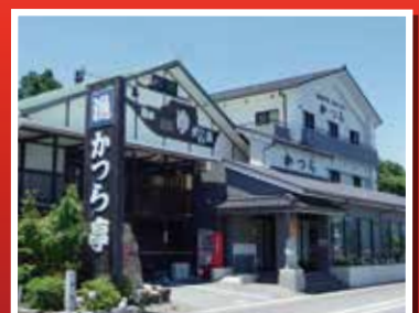
かつら亭蒲刈本店